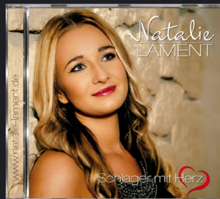
SCHLAGER MIT HERZ 2017