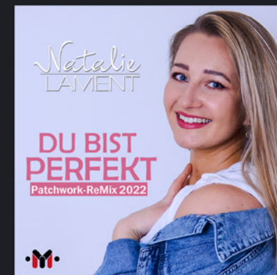
DU BIST PERFEKT (PATCHWORK REMIX) 2022